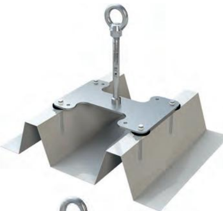
Abb. 8, 9: Einzelanschlagpunkte