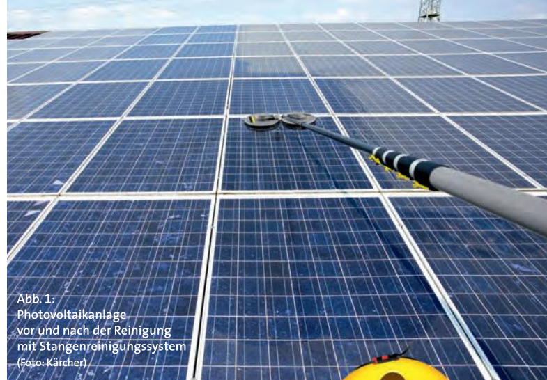
Abb. 1: Photovoltaikanlage vor und nach der Reinigung mit Stangenreinigungssystem

Da die Baustellenverordnung durch ihre Anwendungsbegrenzungen bei nachträglichen Installationen in vielen Fällen nicht gilt, werden Sicherheitsmaßnahmen von Bauherren, aufgrund fehlender gesetzlicher Vorgaben und/oder aus Kostengründen, oft vernachlässigt. Diese Aussage beruht auf Erfahrungen des Autors im Bereich der Photovoltaikreinigung.