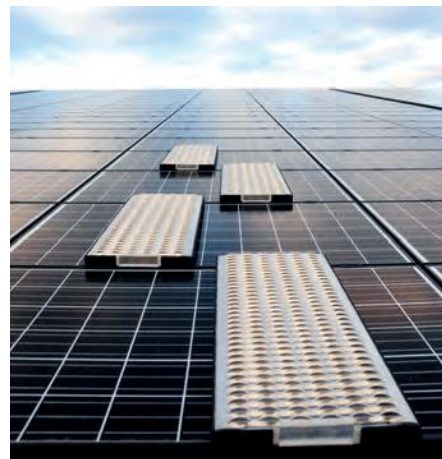
Abb. 5: Mobile Laufwege

personal auch in alle Richtungen gegen Absturz gesichert. Bei einer Trapezblecheindeckung können Systeme in Verbindung mit Schrauben und Kippschrauben verwendet werden (Abb. 8, 9).