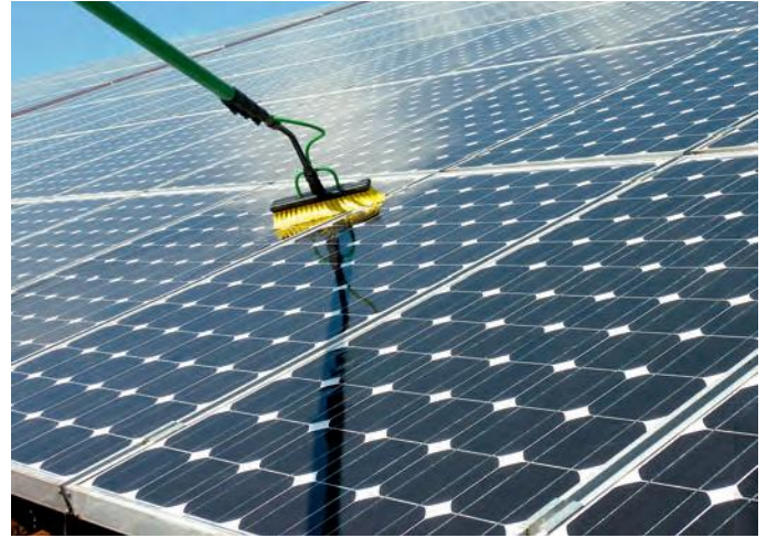
Abb. 11: Mit einem teleskopierbaren Stangensystem können verschiedene Höhen erreicht werden

Beim Arbeiten aus Hubarbeitsbühnen heraus sollte PSAg verwendet werden.