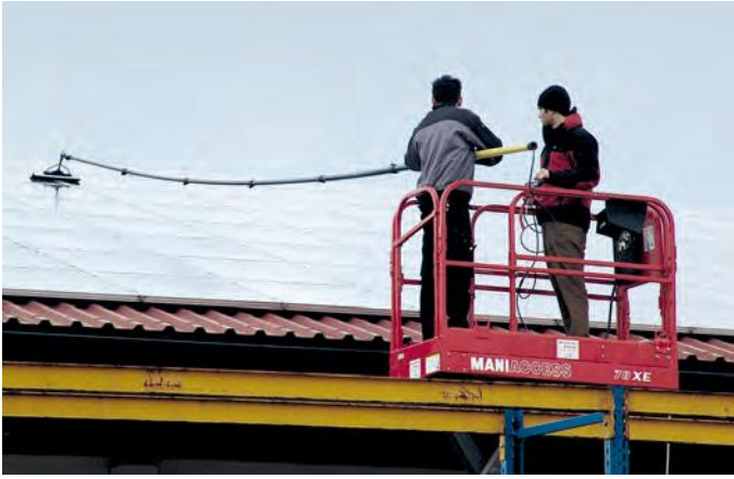
Abb. 10: Mit Stangenreinigungssystemen können Photovoltaikanlagen sicher vom Boden oder von einem Hubsteiger aus gereinigt werden