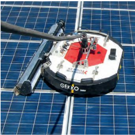
Abb. 12, 13: Reinigungsroboter können sicher vom Boden oder vom Hubsteiger aus fernbedient werden