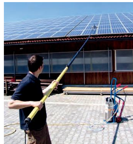
Abb. 2: Mit Stangenreinigungssystemen können Photovoltaikanlagen vom Boden aus gereinigt werden

Die Mitarbeiter bei der Photovoltaikreinigung sind, neben der Absturzgefahr, einer Vielzahl von arbeitsplatzbezogenen Gefährdungen ausgesetzt, z.B. elektrische Gefährdung, Brand, Stolpern, Rutschen, Stürzen, UV-Strahlung etc. Maßnahmen zur Absturzsicherung sind nach § 4 Arbeitsschutzgesetz vorrangig als Kollektivschutz auszubilden. Das heißt, diese