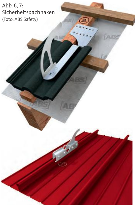
Abb. 6, 7: Sicherheitsdachhaken

Die dargestellten Varianten minimieren das Absturzrisiko bei Arbeiten an und auf Photovoltaikanlagen. Jedoch müssen die nachträglich zu errichtenden Anschlagpunkte in den meisten Fällen berechnet und fachgerecht eingebaut werden, was einen erheblichen Kostenfaktor darstellt. Zusätzlich sind diese Systeme nicht dem technischen Schutz nach dem TOP-Prinzip (technisch vor organisatorisch vor persön-