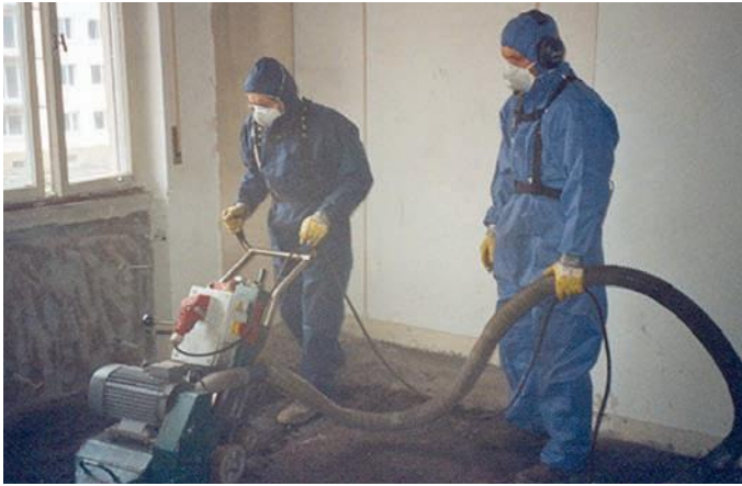
Abb. 8: Fräse mit Absaugung