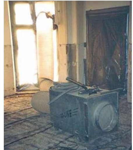
Abb. 9: Technische Lüftung

nahme anzupassen. Neben den stoffbezogenen Gefährdungen sind auch alle weiteren Gefährdungen, die durch die Tätigkeiten auftreten können, zu berücksichtigen: z.B. Absturz, unzureichende Beleuchtung, Heben von Lasten.