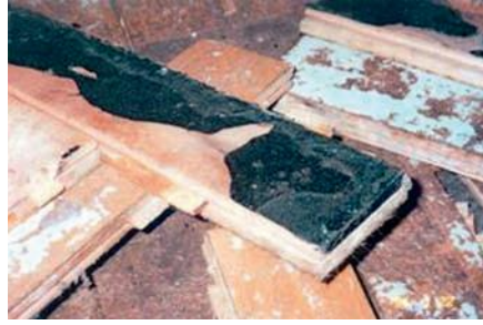
Abb. 7a, b: Sanierung PAK-haltiger Parkettkleber