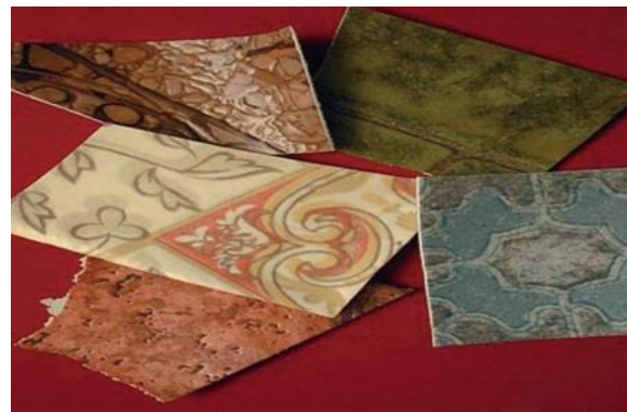
Abb. 2: PVC-Bodenbelag mit asbesthaltiger Trägerschicht