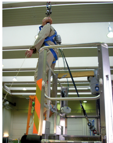
Bild 6 Versuchsanordnung Simulation Sturz beim Übersteigen.