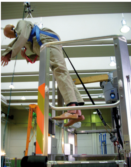
Bild 5 Versuchsanordnung Simulation Sturz beim Hinauslehnen.

Deshalb wird aufgrund der Untersuchungsergebnisse empfohlen, zukünftig von der Benutzung eines Rückhaltesystems abzusehen und generell ein