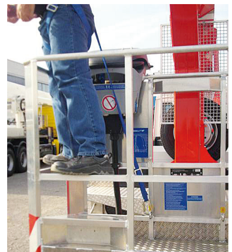
Bild 2 Nicht bestimmungsgemäßes Verwenden eines Rückhaltesystems.

Die Risiken sind vielfältig und nicht nur theoretisch betrachtet, wie auch das aktuelle Unfallgeschehen der letzten Jahre leider beweist. So haben sich in kür-