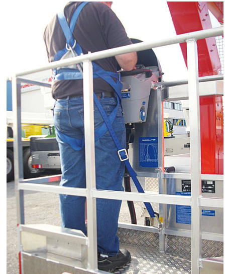
Bild 3 Verbindungsmittel zum Rückhalten mit Reibsnalle zur Längeneinstellung,