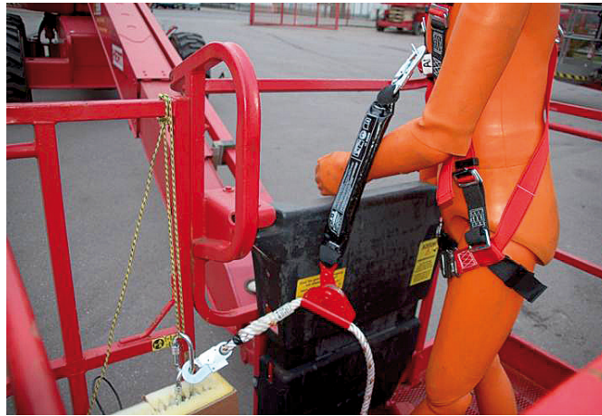
Bild 7 Simulation Sicherung durch mitlaufendes Auffanggerät einschließlich beweglicher Führung.

Hierzu wurden handelsübliche Ausrüstungen, wie Verbindungsmittel mit Längeneinstellvorrichtung und Falldämpfer, mitlaufende Auffanggeräte ein-