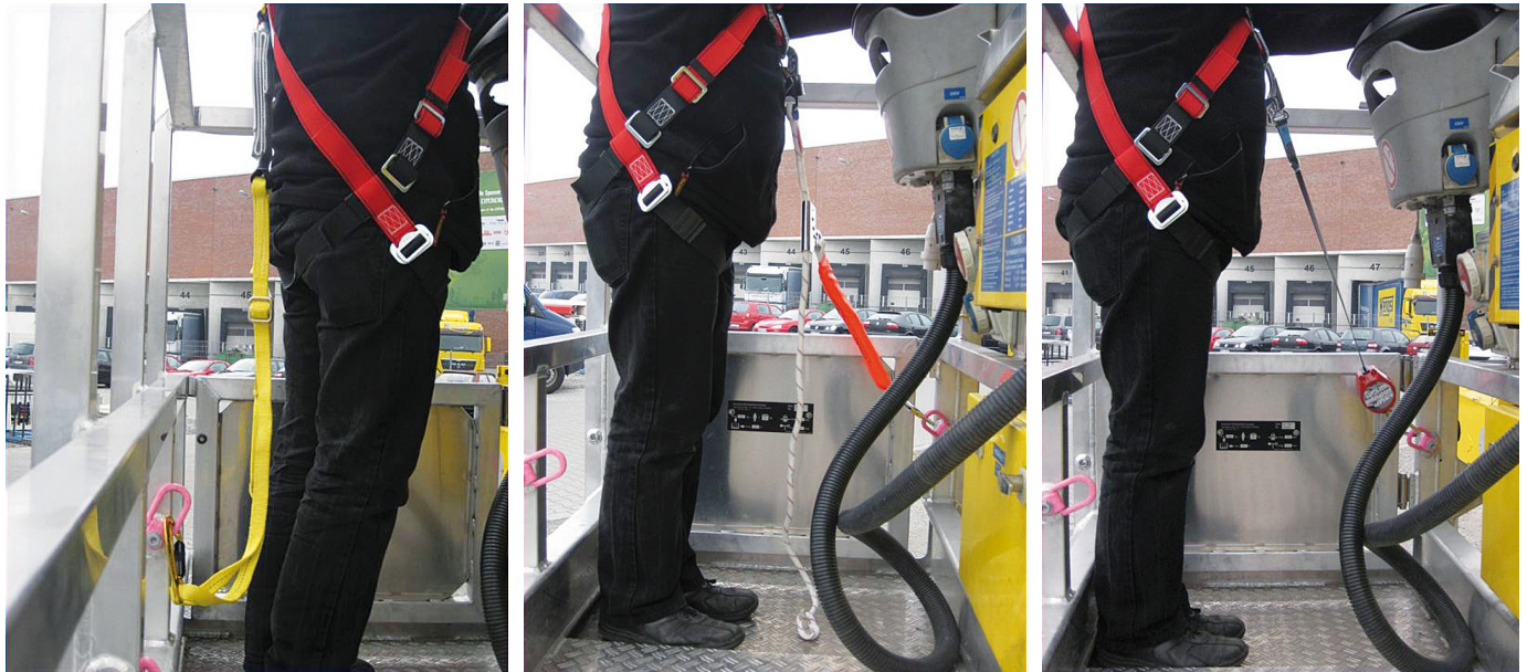
Bild 11 Lösungsansätze Auffangsystem max. Länge 1,80 m mit einstellbarem Verbindungsmittel mit Falldämpfer (links), mit mitlaufendem Auffanggerät einschließlich beweglicher Führung (Mitte), mit Höhensicherungsgerät (rechts).