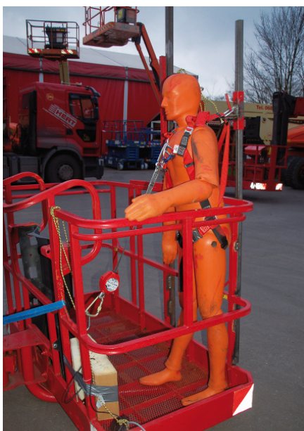
Bild 8 Simulation Sicherung durch Höhensicherungsgerät.

Bei der Bewertung der Gefährdungen sind die verbleibenden Restrisiken, wie z. B. die Verletzungsgefahren beim Auffangvorgang und das Umkippen der Hub-