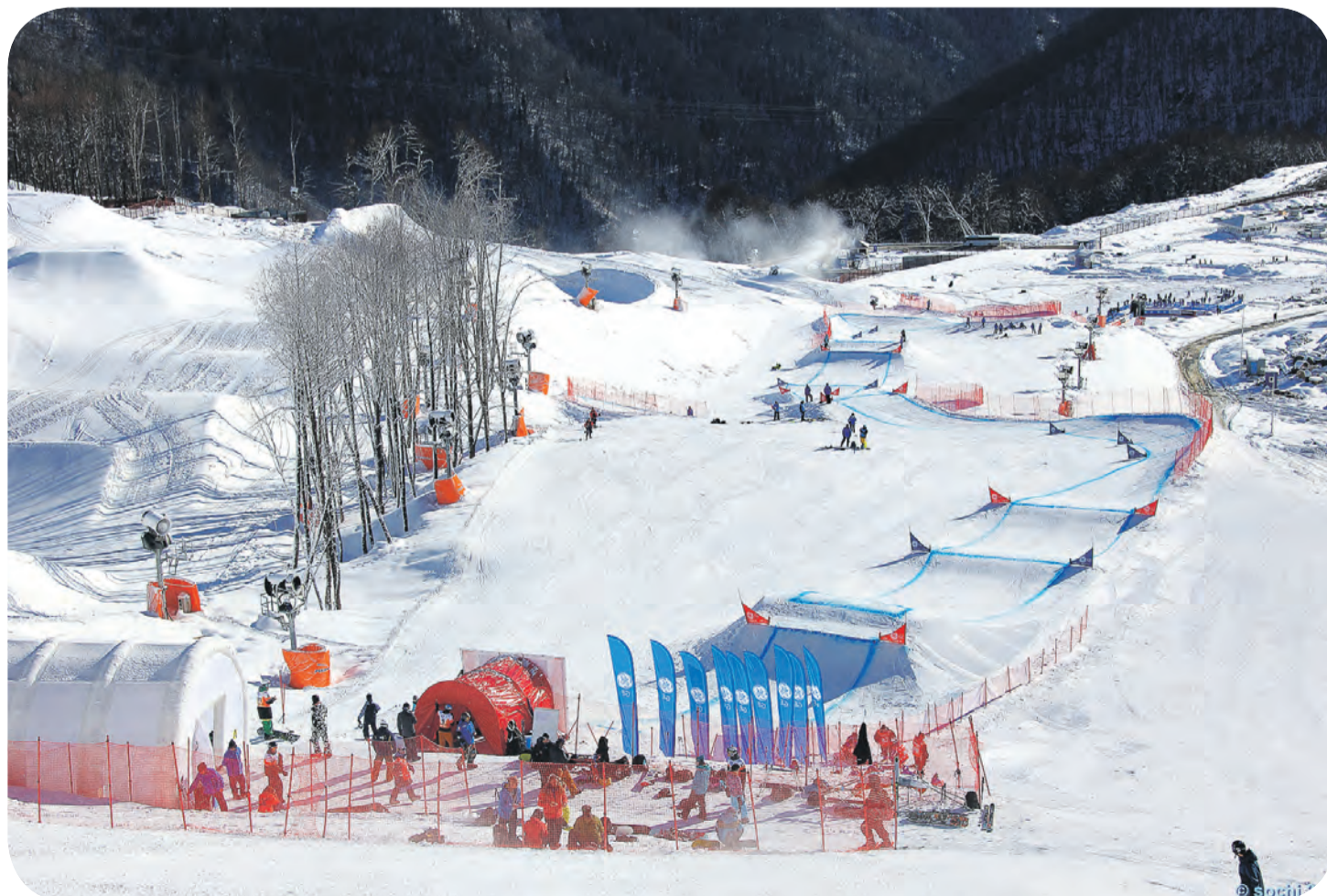
Трасса для адаптивного сноубординга отличается меньшим перепадом высот

— Полный состав команды будет озвучен после 24 февраля. Парасноуборд в России пока только зарождается. Мы отстаем в том числе и из-за недостаточной информационной поддержки – не так много инвалидов знают, что могут кататься на сноуборде, я уже не говорю о занятии этим профессионально. Что касается трассы в Сочи, то мы были на ней на тестовых соревнованиях в марте прошлого года. Но с того момента она изменилась. Новая схема уже опубликована, мы ее изучаем, чтобы понять, как пройти ее наиболее успешно.