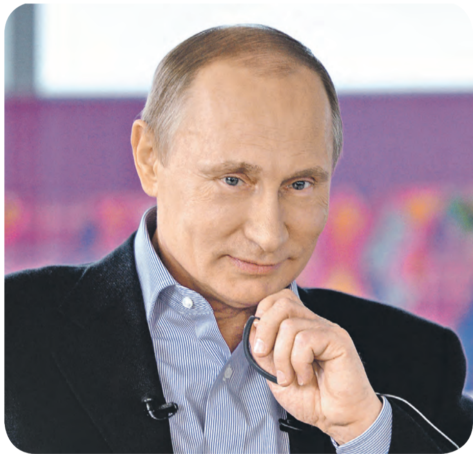
Владимира Путин хочет, чтобы за Паралимпиадой следило как можно больше россиян

Вопросы задавали журналисты газеты «Паралимпийский Репортер»