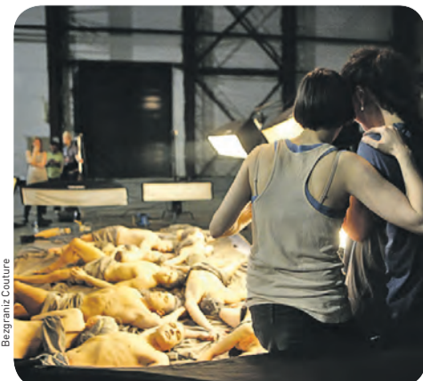
Задача проекта – помочь увидеть красоту «иног» человеческого тела