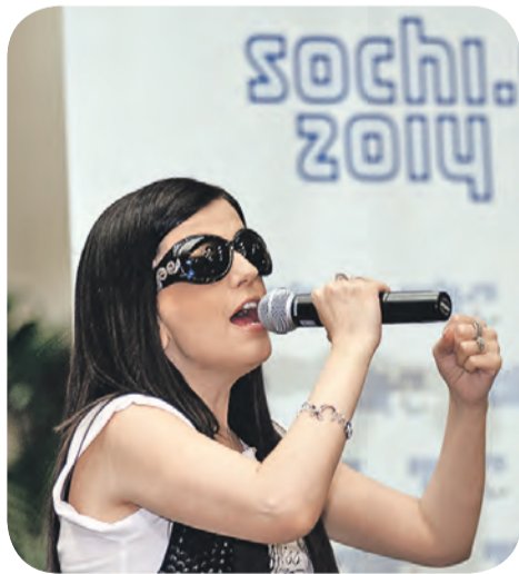
Диана Гурцкая – посол Паралимпийских Игр

К ультурная Олимпиада «Сочи-2014» – проект невероятных масштабов. Каждый год в рамках культурной программы был посвящен определенному виду искусства: 2010 – кино, 2011 – театру, 2012 – музыке, 2013 – музеям. За это время по всей России прошло около трех тысяч мероприятий, в том числе и для инвалидов и с их непосредственным участием.