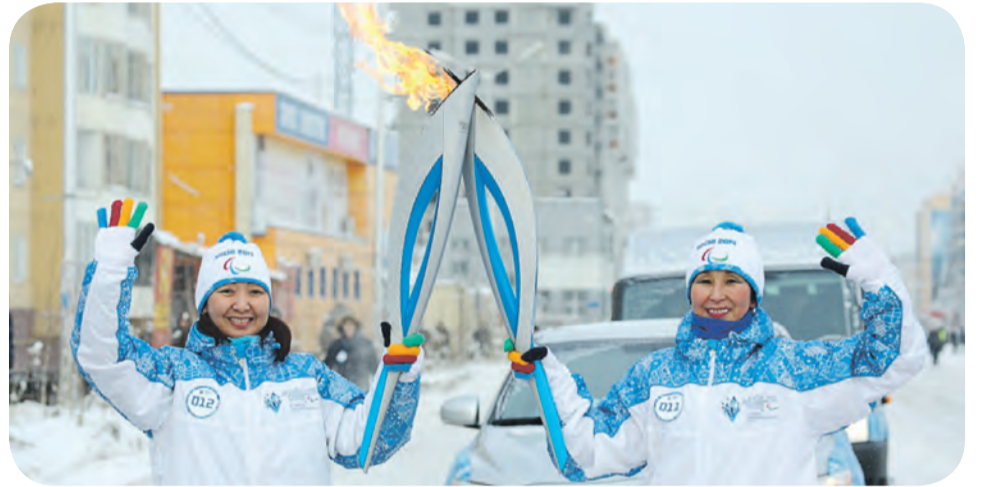
Факел Паралимпиады тоже совершает путешествие по стране, перед тем, как попасть в Сочи

Новый состав нашей сборной дает надежду и на новые медали. Четыре года назад мы завоевали наград больше, чем любая другая страна – 38, но в общем зачете все же уступили сборной Германии, которая выиграла на одну золотую награду больше – тринадцать против российских двенадцати.