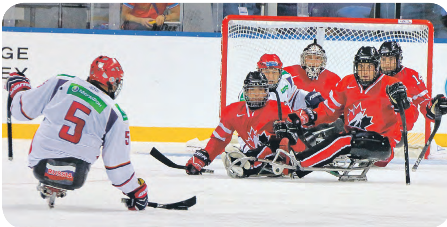
И в следж-хоккее наши главные соперники - канадцы