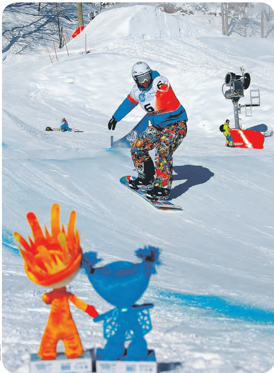
Знание «домашней» трассы поможет в борьбе за медали

От обычного сноуборда адаптивный отличается, понятное дело, перепадом высот. Здесь он меньше – от 100 до 240 метров.