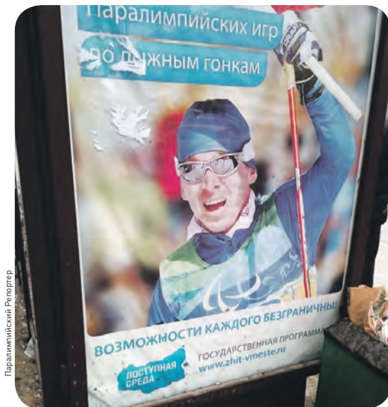
Реклама Паралимпиады понравилась не всем