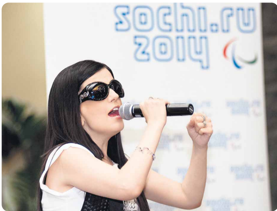
Die georgisch-russische Sängerin Diana Gurzkaja (oben) wird beim integrativen Festival Belaja trost in Sotschi auftreten. Aber auch Traditionelles ist Bestandteil der Kulturolympiade.

V ielheit und Reichtum der russischen Kultur präsentieren: Das ist das Ziel der Kulturolympiade der ersten russischen Winterspiele.