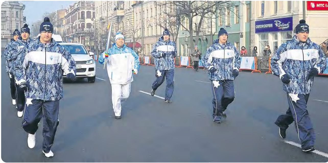
Ein Läufer trägt das Feuer am ersten Tag des paralympischen Fackellaufs durch Wladiwostok.