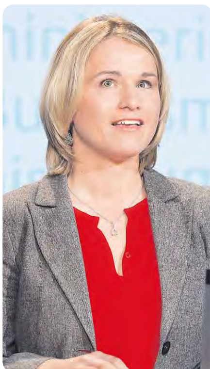
Als Biathletin und Langläuferin gewann Verena Bentele zwölf Paralympics-Goldmedaillen. Viermal wurde sie Weltmeisterin.

„Also ich finde die Kleidung schon sehr bunt, sie fällt auf jeden Fall auf. Da ich privat auch gerne bunte Dinge trage, fühle ich mich darin pudelwohl. Was ich sehr gewagt finde, sind die gestreiften Jacken und die roten Hosen mit Blumenmuster bei den Frauen. Vom sportlichen Aspekt her bietet die Kleidung genau die richtige Mischung aus Komfort und Funktionalität, einzig eine lange Skihose mit Reißverschluss an den Beinen wäre für mich als Rennläuferin noch praktisch gewesen!“