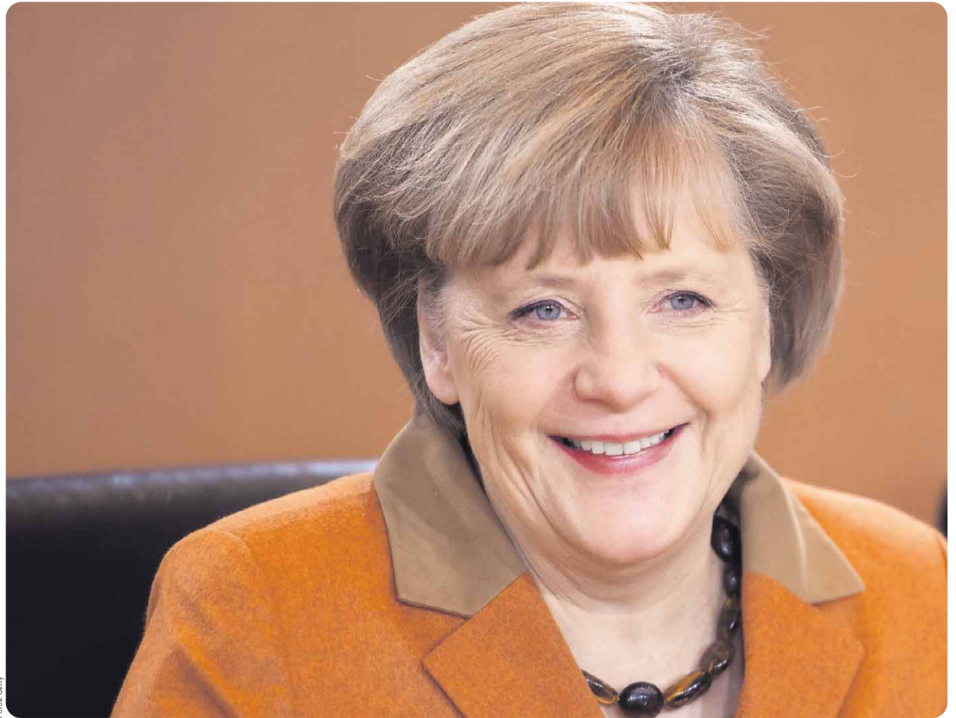
Bundeskanzlerin Angela Merkel verletzte sich im Skiurlaub beim Langlauf. An ihrer Begeisterung für den Wintersport änderte dies nichts. Die Berichte über die Paralympischen Spiele will sie verfolgen – sofern es die Zeit erlaubt.

Am Internationalen Tag der Menschen mit Behinderung im vergangenen Jahr haben Sie in Ihrem Video-Podcast gesagt, dass Menschen mit Behinderung nicht von der