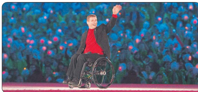
A national hero. Canada's "Man in Motion" Rick Hansen waves to the crowd while entering the stadium during the Opening Ceremonies of the Paralympics.

After seven months of recovery and rehabilitation, Hansen was determined to lead a full life. He found ways to continue playing the sports he loved, and he was ready to make the most of every opportunity for himself and others. Rick Hansen became the first person with a disability to graduate with a Degree in Physical Education at the University of British Columbia. By 1984 he had won a total of 19 International Wheelchair Marathons, and 6 Paralympic medals, 3 each from the 1980 and 1984 games. At university he met Terry Fox, who became a legend by running a marathon across Canada with one leg. His 'Marathon of Hope' inspired Rick Han-