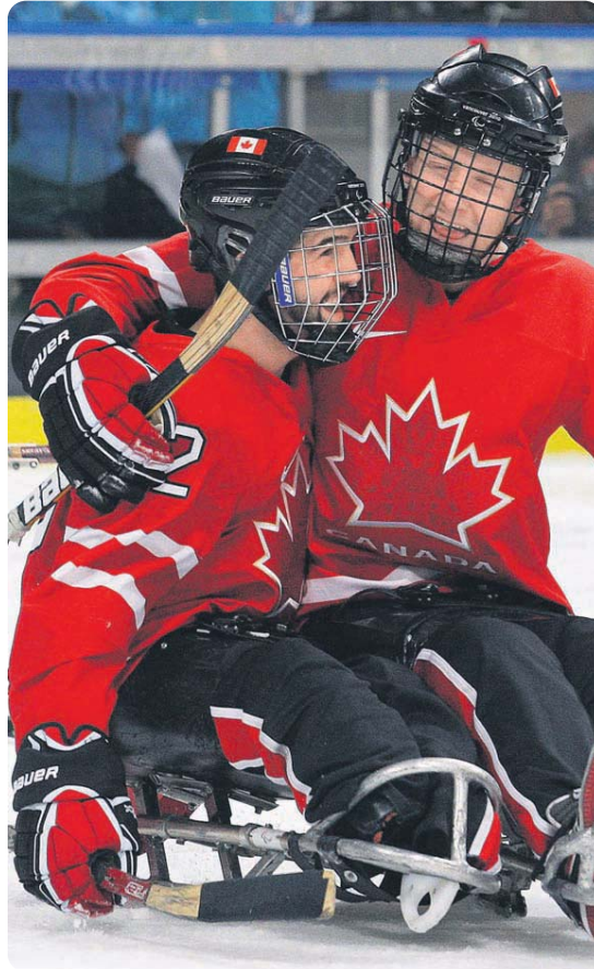
Hockey is Canada's game! The Canadian men's scored often in pounding Sweden 10-1 to run their record to 2-0 in Group B. Pictures: Reuters [3]

The very next day, every team was at it again, playing against another team in their respective four team pools. Canada this time was playing against Sweden, and the final result was a little surprising. Canada opened up the scoring quite early in the game, scoring a goal that made ears ring as a result of the overwhelming response from the crowd. Sweden managed to equalize the game a mere thirteen second later, setting what possibly many believed to be the tone for a very close game. By the end of the first period however, any chance of that seemed to be gone, as Canada pulled ahead to 4-1. By the end of the second period, they had widened their lead to 8-1, and scored another two goals in the third period to finish their game 10-1. Canada seemed much more organized in this game, than the previous game the day before against Italy, passing the puck and getting things done, while Sweden's offensive line just seemed absent,