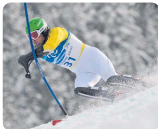
Vorbeigerauscht. Trotz schwieriger Pistenverhältnisse schlangelte sich Schönfelder auf Platz zwei.

Andrea Rothfuß fährt im Slalomrennen der stehenden Athletinnen wie bereits in Turin aufs Podest