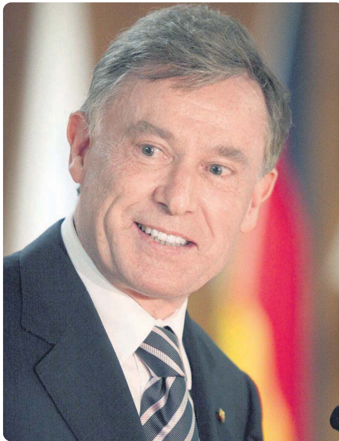
Bundespräsident Horst Köhler, 67, bewundert die paralympischen Athleten. Er sieht in ihnen große Vorbilder für Menschen mit und ohne Behinderung.

Ihre Tochter Ulrike hat ihr Abitur auf der Blindenstudienanstalt Blista in Marburg absolviert. Wäre es nicht sinnvoller heutzutage, im Sinne der Gleichstellung Sehbehinderte oder beziehungsweise auch Körperbehinderte eine Regelschule besuchen zu lassen?