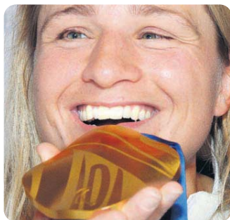
Strahlende Siegerin: das zweite Gold für Verena Bentele.

Zum Relaxen bleibt ihr nur wenig Zeit. Auslaufen, Siegerehrung, Pressekonferenzen – der Tag ist ausgefüllt. Während des Rennens betonen die Stadionsprecher immer wieder, dass für die Blinden auch im