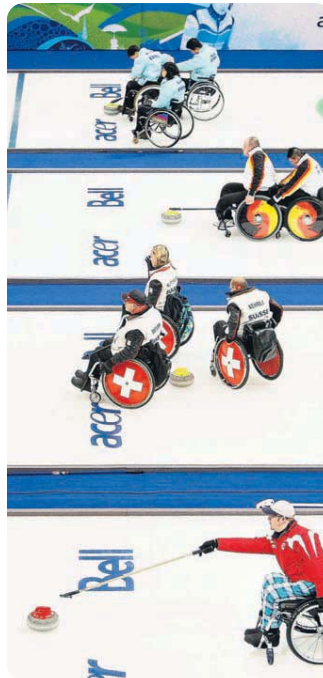
Rocks, rocks, rocks. A general view of the competition during the Wheelchair Curling Round Robin games on day three of the Paralympic Games at Vancouver Olympic Centre.

After a tough fifth end, Team USA started to regain focus heading into the sixth end where they put up a fight to almost score a point but Canada managed to steal another two points when they knocked out the US stone. During the seventh end Team Canada's skip narrowly missed his first shot to knock out a US stone and on his second shot, the stone caught a US guard and failed to make it into the house. The crowd all felt the disappointment with him as everyone gave a collective sigh. But then Perez threw his last rock for the US too heavy and it went through the house. Which only allowed them to get two points out of a possible three. Canada lead 10-5 at the end of the seventh end. In the eighth end, Team USA made their last attempt to catch up to Team Canada but the game was ended after the thirds threw their last rock by a call from Team USA. The final score was 10-5, in Canada's favor.