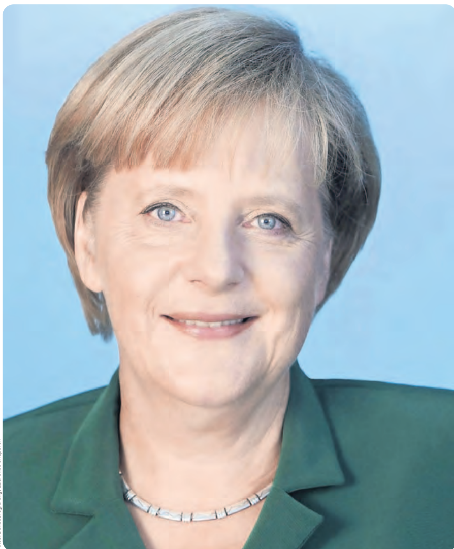
Bundeskanzlerin Angela Merkel erwies sich im Interview als gute Kennerin der Paralympischen Spiele.

Die Fragen stellten die Schülerreporterinnen und Schülerreporter der Paralympics Zeitung