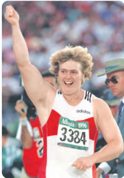
Immer noch sehr stark im Ring. 1996 wurde Ilke Wyludda Olympiasiegerin im Diskuswurf (linkes Bild). Jetzt wird sie in London bei den Paralympics antreten.

seine Arme wieder eingeschränkt bewegen. Und auch dem Turnen ist er weiter verbunden geblieben. Von den Spielen in London berichtete er als Co-Kommentator für das ZDF von den olympischen Turnwettkämpfen in England.